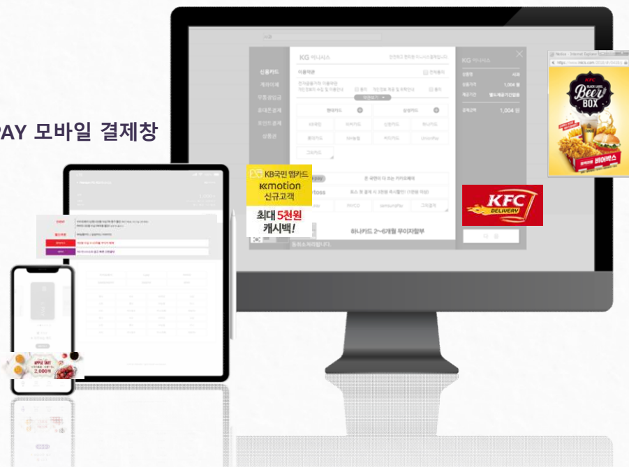
INIPAY 모바일 결제창