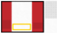
결제창 중앙 하단