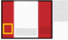
결제창 좌측 하단