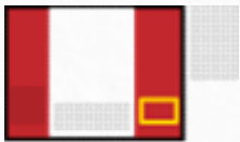
결제창 우측 하단