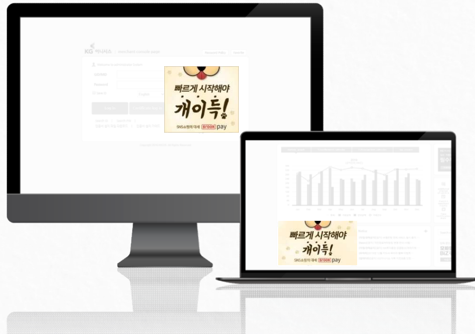
[KG이니시스 가맹점 분포도]